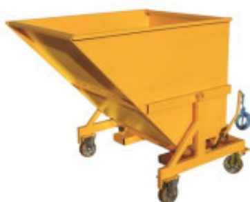
BAD 1320 LITRES SUR ROUES