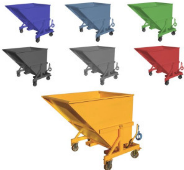
BAD 1100 LITRES SUR ROUES